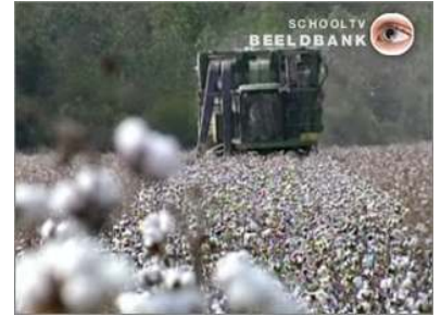
oogst van katoen in Amerika

Deze Amerikaanse boeren krijgen elk jaar ongeveer 4 miljard dollar euro subsidie. Je schrijft het zo: $ 4.000.000.000.