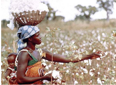
pluk van katoen in Tanzania