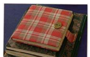
Dagboek van Anne Frank